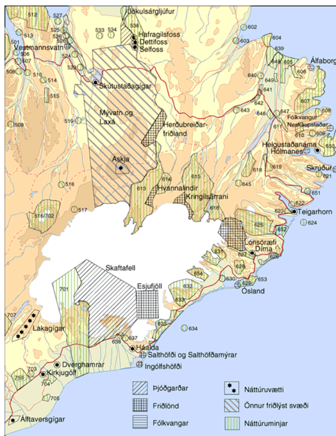
1. Mynd. Náttúruverndarsvæði í nágrenni Vatnajökuls.